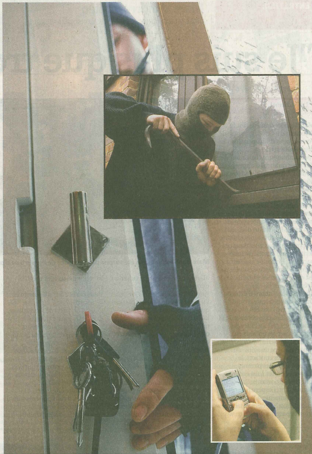
En cas d'intrusion, la domotique connectée à votre smartphone permet de suivre la scène.